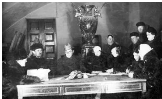
Рис. 5. Фотограф П.Е. Корнилов (1896–1981).

а также на главного хранителя – М.В. Фармаковского, существенным вкладом которого стал отчет о состоянии художественных ценностей и акт об ущербе, нанесенном экспонатам ГРМ в результате военных действий 1943 г., а также его научные труды [1, с. 56].