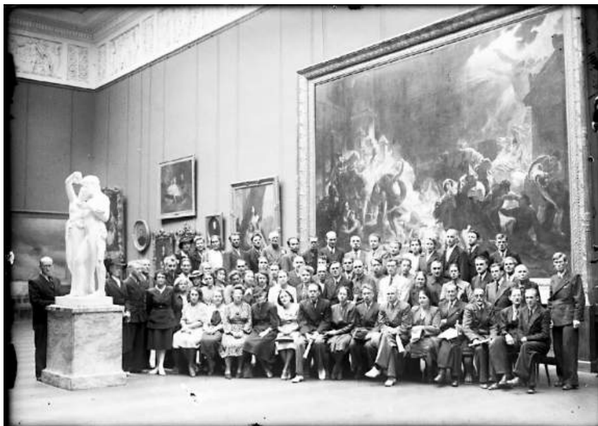
Рис. 8. Участники Всероссийского совещания директоров и хранителей фондов художественных музеев. 16–24 июня 1947 г.

Основными задачами совещания были: определение нанесенного войной материального ущерба коллекциям, оценка возможностей по консервации и реставрации художественных ценностей и путей дальнейшего восстановления утраченного или разрушенного во время Великой Отечественной войны. Обсуждались вопросы по хранению, консервации и реставрации памятников изобразительного искусства, участников знакомили с коллекцией Русского музея и экспозиционной работой, для хранителей были предусмотрены элементы курсов повышения квалификации, затрагивались вопросы по проведению просветительской работы. Помимо этого, для участников совещания была организована экскурсионная программа [3, с. 100–102].