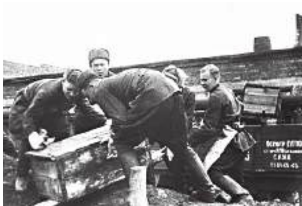
Рис. 1. Эвакуация оборудования ИЗ в августе 1941 года

В этот период на Ижорском заводе, впервые в теории броневом производстве, были созданы технически обоснованные, проверенные на практике технологические инструкции на каждую операцию металлургического процесса производства броневой стали. Новая форма организации производства сыграла решающую роль в годы Великой Отечественной войны, когда производство брони для танков организовывалось на заводах Урала и Сибири [1, с. 165] (рис. 1).