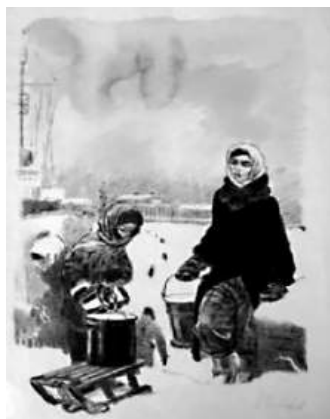
А.Ф.Пахомов. За водой

содержание и тон отличаются от тех, что писали эрмитажники своим коллегам, находящимся в эвакуации, и, конечно, от дневников, которые не были предназначены для цензуры, им авторы могли доверить свои чувства. На многих письмах со штампом «проверено военной цензурой», хранящихся в Архиве Эрмитажа, есть пометки: некоторые строчки жирно замазаны черной краской. В то время страшные подробности блокадной жизни, во избежание паники,