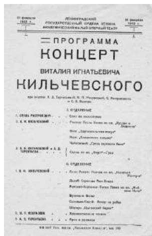
Рис. 6. Концертная программа солиста МАЛЕГОТа В.И. Кильчевского. 1943 г.

Сохранившиеся документы свидетельствуют, что с приездом МАЛЕГОТа культурная жизнь в Чкалове заметно оживилась. От спектакля к спектаклю повышался и всё возрастал интерес к театру. Каждый вечер жители города и эвакуированное население спешили