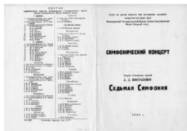
Рис. 5. Программа симфонического концерта. 1942 г.

Прозвучавшая в исполнении симфонического оркестра МАЛЕГОТА симфония произвела огромное впечатление как на слушателей, так и на артистов театра. По воспоминаниям ведущего солиста Б.О. Гефта: «В тот момент, когда прозвучали на сцене Ленинградского академического Малого оперного театра первые такты Шестой симфонии Чайковского, а затем Седьмой симфонии Шостаковича, казалось, что стены Чкалова раздвинулись, что город умылся, приоделся, обновился... Здесь была высота большого артистизма, то есть исполнение, углубляющее и обогащающее автора...» [2, с. 114]. Сам дирижёр Б. Хайкин отмечал: «В 1942 г. я получил первые оттиски седьмой симфонии Д. Шостаковича. Мы её быстро расписали и в течение сезона 1942/1943 года играли семь раз в Оренбурге и два раза в Орске. Это было событие для всех, а для меня в особенности. Ведь автора рядом не было, и я готовил премьеру наедине с партитурой!» [2, с. 113]. Кстати, в 1943 г. Борису Эммануиловичу довелось дирижировать Седьмой симфонией в Москве, в Большом зале консерватории. В этот раз репетиции и концерт прошли в присутствии Дмитрия Шостаковича, который, отметив дирижёрское мастерство