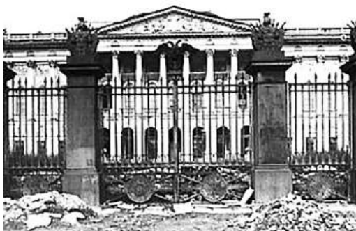
Рис. 1. Музей в годы войны. 1945 г.

На 1941 г. была запланирована кардинальная реэкспозиция Русского музея. 7 мая 1941 г. на заседании Ученого совета музея обсуждался её генеральный проект [5]. К началу Великой Отечественной войны фонды Русского музея насчитывали более 166 000 произведений живописи, графики, скульптуры, декоративно-прикладного искусства. Работали более 300 человек, из них 90 научных и научно-технических сотрудников [1, с. 20].