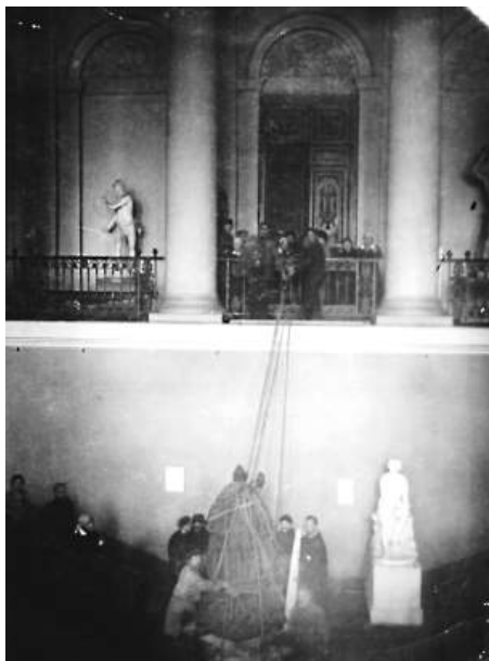
Рис. 4. Неизвестный фотограф. Парадный вестибюль главного здания (Михайловский дворец). Перемещение скульптуры «Анна Иоанновна» (1741) в укрытие. 1941 г.

В военное время были и сокращения работников. Сотрудники, которые были уволены, не получали карточки на питание и не имели довольствия, поэтому многих из них это привело к смерти. Такая судьба постигла тех, чья де-