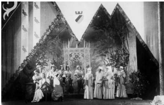
Рис. 1. Сцена из спектакля «Иоланта».