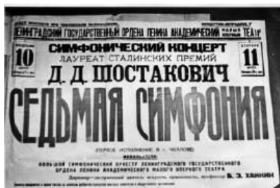
Рис. 4. Фотокопия афиши