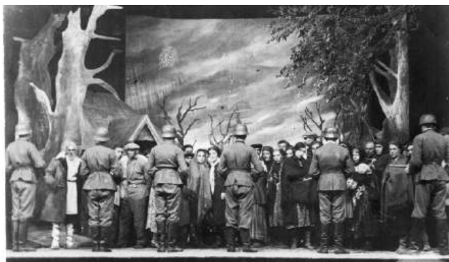
Рис. 2. Сцена из спектакля «Сильнее смерти».

Удивительно, но Чкалов стал местом написания новых музыкальных произведений. Автор опер «Тихий Дон» и «Поднятая целина», поставленных на сцене Малого оперного в 1930-е гг., композитор Иван Дзержинский, оказавшийся в одном эшелоне с труппой МАЛЕГОТа, создал в эвакуации ещё две оперы на тему героической борьбы советского народа в годы войны – «Кровь народа» и «Надежда Светлова». На эту же тему другой ленинградский композитор Виктор Волошинов, также эвакуированный в Чкалов, поставил оперу в 3-х действиях «Сильнее смерти».